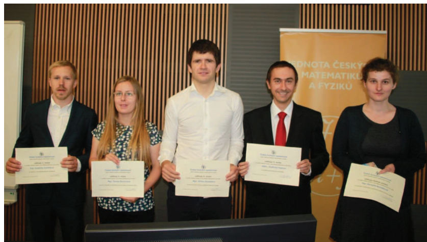
Pět laureátů Ceny Milana Odehnala