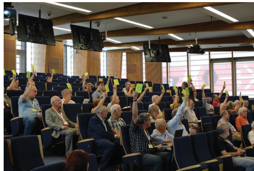
Delegáti při schvalování sjezdových usnesení